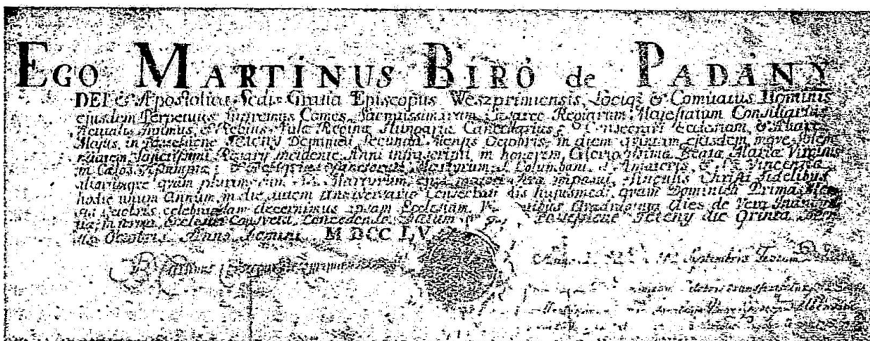
A nagytényi templom felszentelő okmánya 1755-ből.