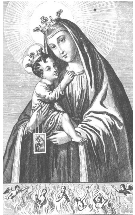
Imago B. Mariæ Virg. in Radua Dioc. Chanáa

Akathiszt = görögkeleti himnusz, ismeretlen költő dicsőítő éneke a VI. századból Ikosz = rövid, változó egyházi ének Ezt a görögkeleti himnuszt abból az alkalomból idéztük, hogy a közelmúlt időszakban nemcsak templomunk búcsúja volt, hanem a Mária ünnepek zöme is: