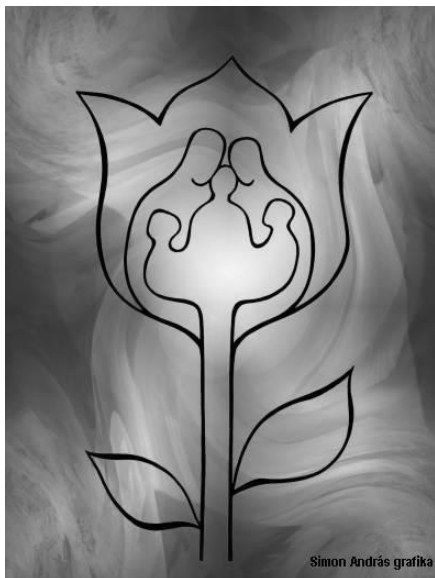
Simon András grafika