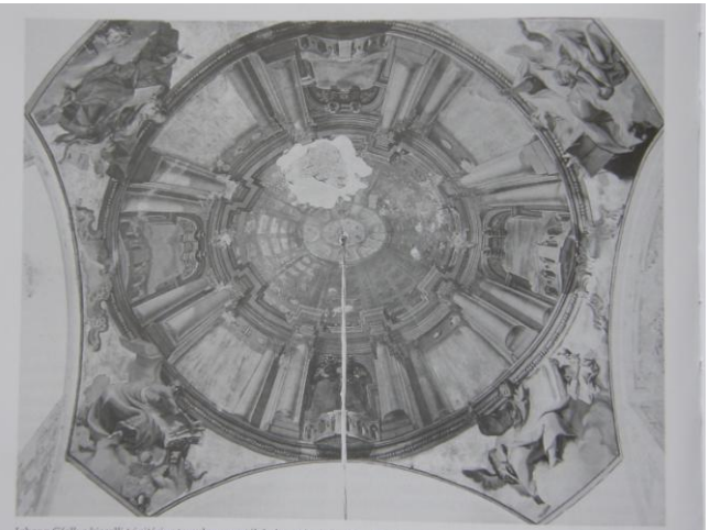
Az egykori Kiscelli Trinitárius Templom kupolája