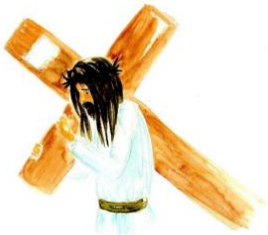
A RAJZOT KÉSZÍTETTE: PALLAGI VIRÁG