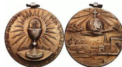
Az 1938-as magyarországi kongresszus emlék-érméje

(A Magyar Kurír írásainak felhasználásával Botos I.)